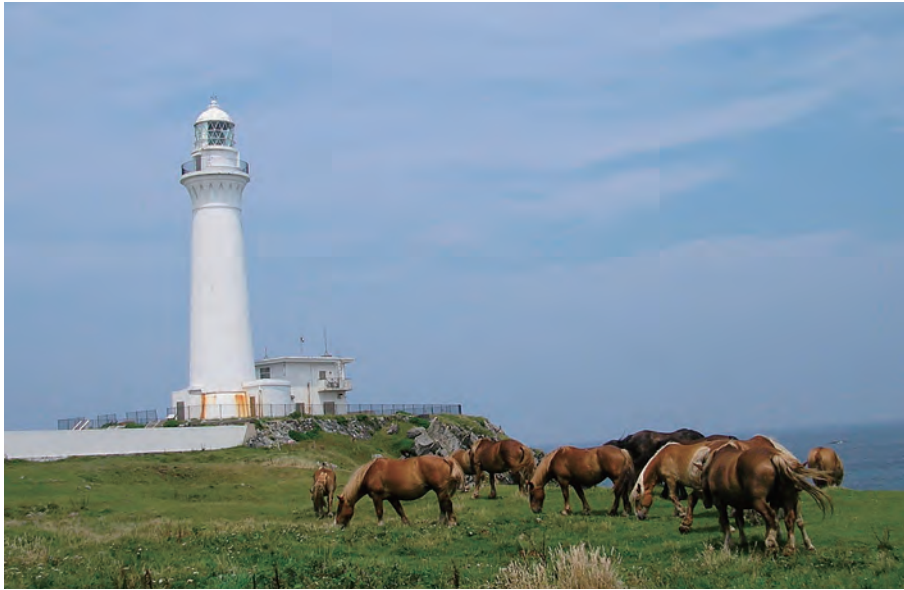
尻屋崎灯台と寒立馬